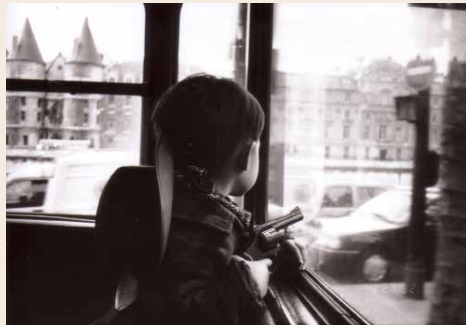
Mon fils, Paris, 1995, tirage argentique sur papier baryté, 30x40 cm. En haut: Mai Duong.

Sélectionnée par Connaissance des Arts pour le concours Zoom du Salon de la photo 2013, Mai Duong fabrique ses images à partir de visages et de paysages.