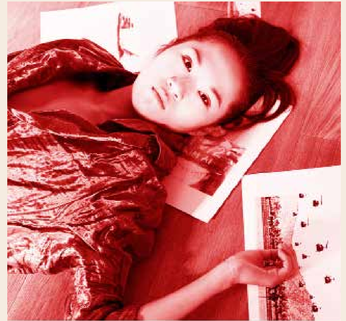
1. L'image évitée, 2009, tirage jet d'encre pigmentaire, 40x30 cm. 2. L'âge et la beauté, 1995, tirage argentique sur papier baryté, 40x30 cm. 3. Mardi, série Chambres, couloirs et obsessions, 2003, tirage argentique sur papier baryté, 30x40 cm.